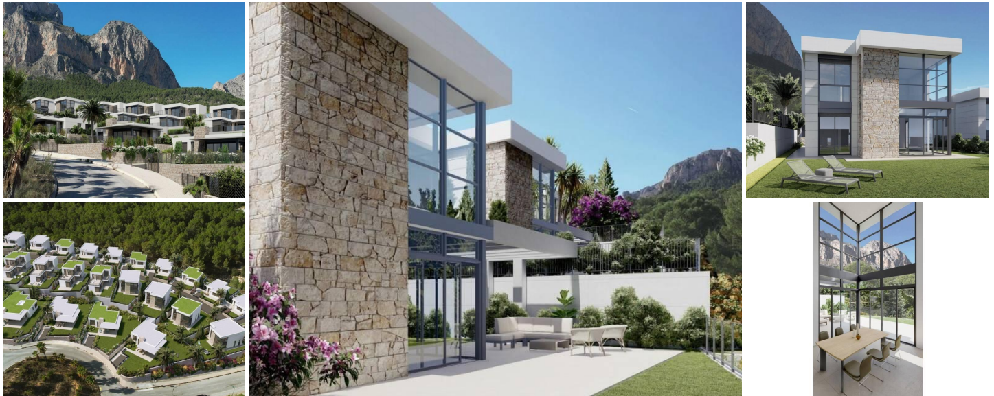
Neubau Villen in Polop, Alicante