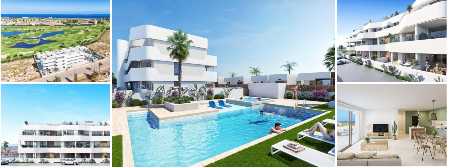
Neubau-Wohnanlage in Los Alcázares

Los Alcázares ist ein idyllischer Ort für diejenigen, die in eine neue Wohnimmobilie an der Costa Cálida investieren möchten. Nur 25 Minuten vom Flughafen Murcia und ca. 55 Minuten vom Flughafen Alicante entfernt, ist diese Gegend über die Autobahn bequem mit den großen Städten wie Cartagena, Murcia und Alicante sowie mit anderen schönen Stränden an der Costa Cálida und der Costa Blanca verbunden.