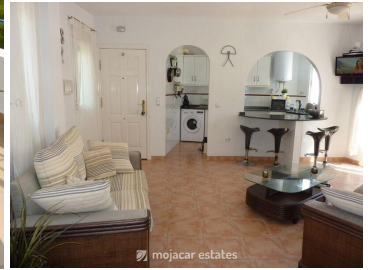
La Casa Redonda

Einzigartiges rundes Penthouse mit 3 Schlafzimmern und spektakulärem Blick auf die Berge und das Meer in Gemeinschaft mit Swimmingpool ca. 400 Meter vom Strand und allen Annehmlichkeiten in Playa de las Ventanicas in Mojácar entfernt.