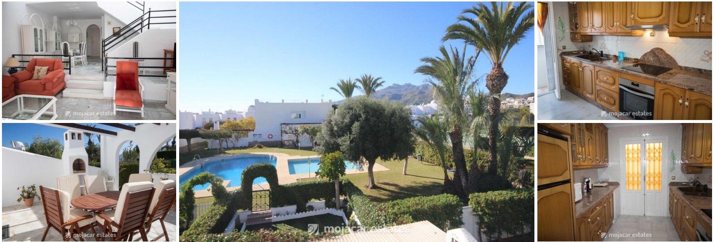
Jardin del Palmeral

Fantastisches Stadthaus für Ferienvermietungen in einem Komplex mit Swimmingpool und Tennis und nur einen kurzen Spaziergang vom Strand und den Annehmlichkeiten in Mojácar Playa entfernt.