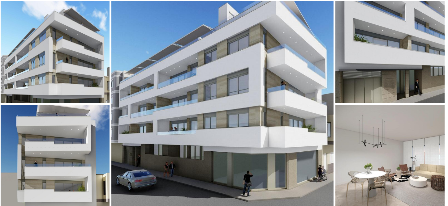
NEUBAU WOHNUNG IN TORREVIEJA

Neubau Wohnanlage nur 5 Minuten zu Fuß vom Strand Los Locos, im Zentrum von Torrevieja.