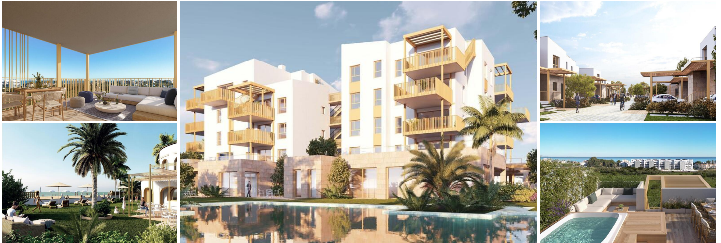
NEUBAU WOHNANLAGE IN EL VERGEL

Neubau eines Wohnkomplexes mit 65 modernen 2-Schlafzimmer-Apartments und 2 und 3-Schlafzimmer-Stadthäusern in El Vergel.