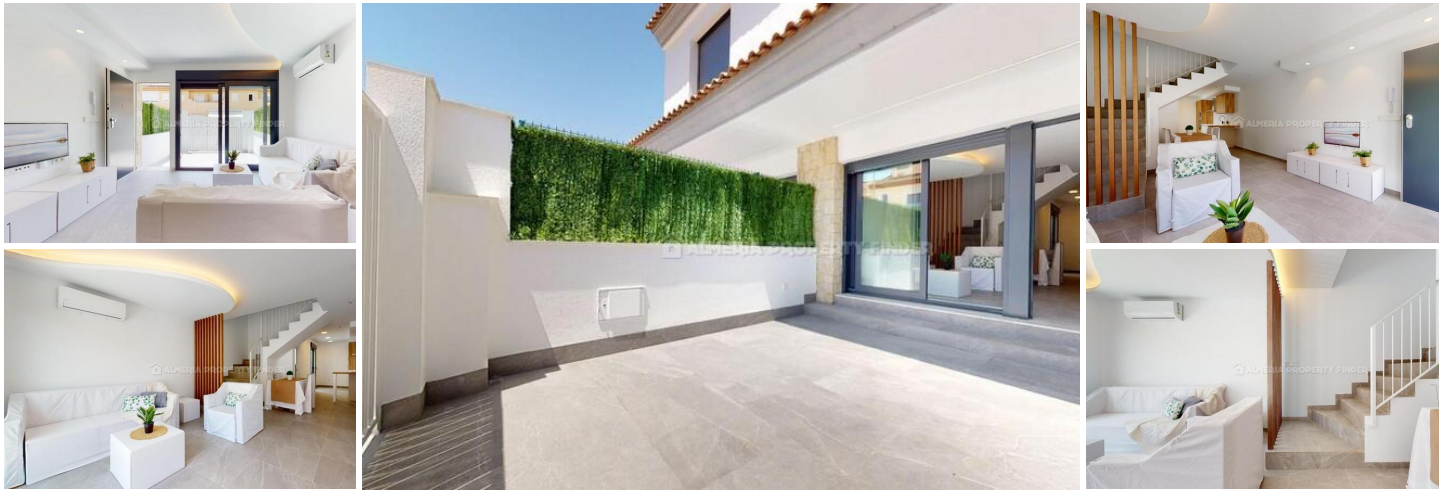
Maison de ville 3

Maison familiale de 147,95 m 2 construits. surface utile de 111,75 m 2 , 3 chambres, 3 salles de bains, 3 toilettes, 3 terrasses, placards, cuisine équipée, climatisation fente.