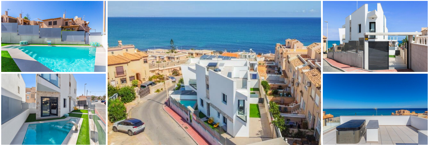
VILLA AM STRAND VON LA MATA - TORREVIEJA!

Exklusive Villa zwischen "La Mata" und "Cabo Cervera", die Entfernung zum Meer beträgt 140 Meter von der Villa und 250 Meter vom Badestrand "Cabo Cervera" und 350 Meter von den Stränden von "La Mata" . Mehrere der besten Restaurants der Gegend befinden sich im Umkreis von 200 m und mehrere Servicebereiche im Umkreis von 350 m.