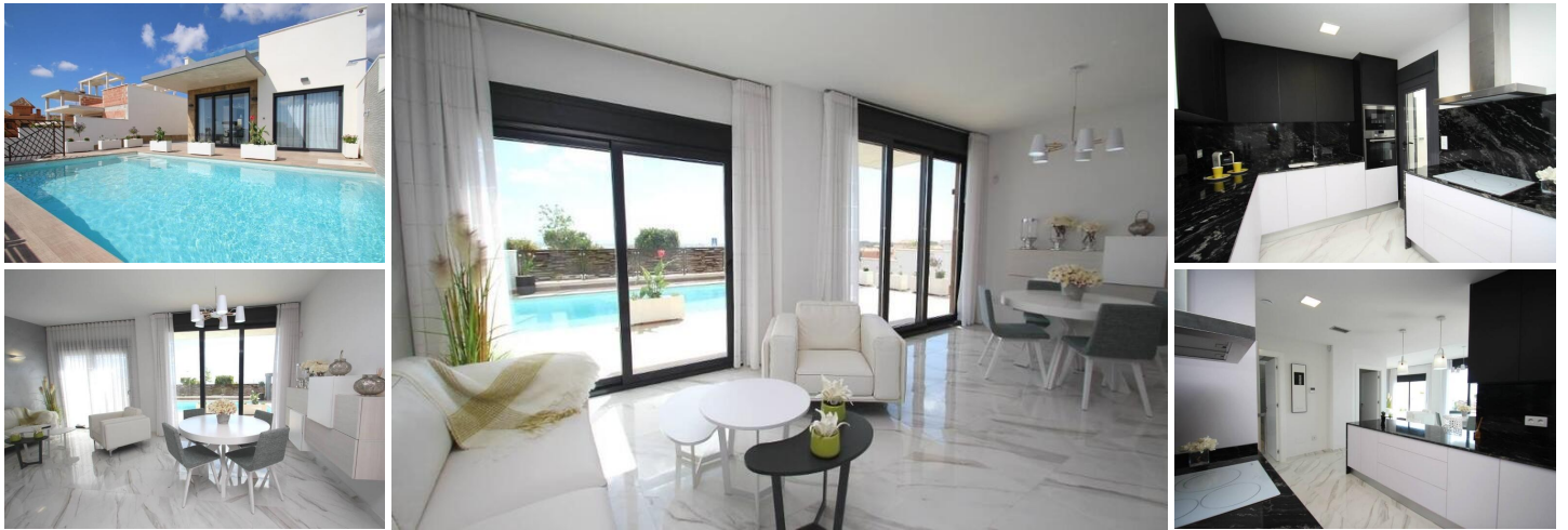
Neubauvilla in Orihuela Costa

Möchten Sie einen exklusiven Urlaub am Meer genießen? Unmöglich, nicht auf diese hochmoderne Villa in Orihuela Costa mit 2 Schlafzimmern, 2 Bädern, privatem Pool, Garten und luxuriösen Extras nach persönlichen Vorlieben hereinzufallen. Seine empfindliche Infrastruktur integriert sich in die Natur und bietet eine ruhige und isolierte Umgebung.