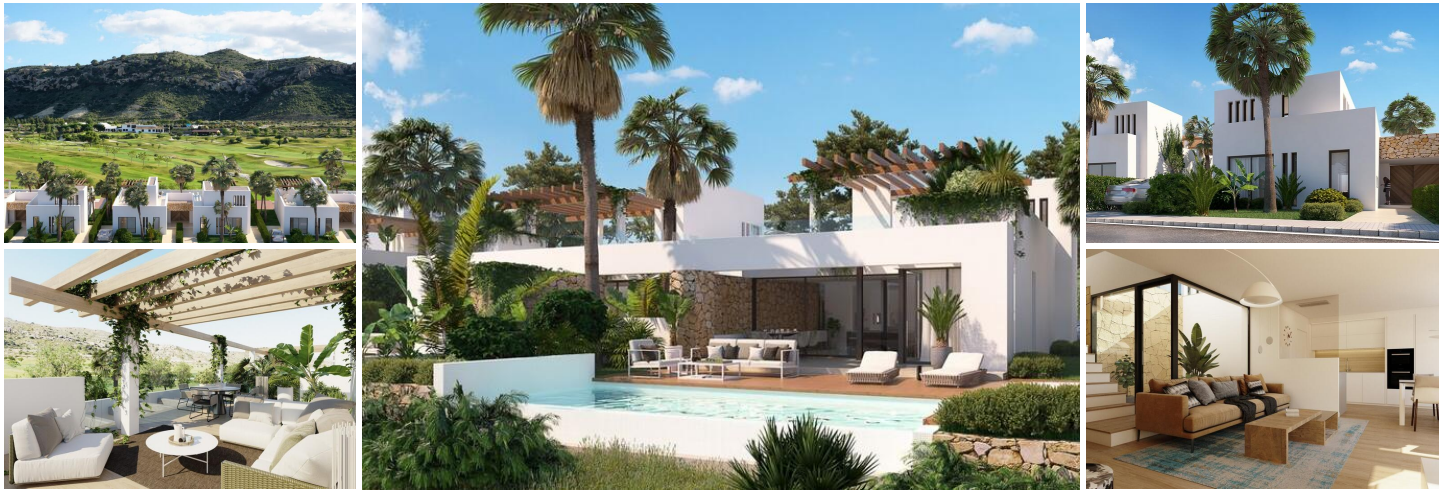
GOLFOVILLA IN ERSTER LINIE IN FRONT DEL LLOP

Neu gebaute Villa mit privatem Garten, Schwimmbad und Solarium, Parkplatz auf dem Grundstück.