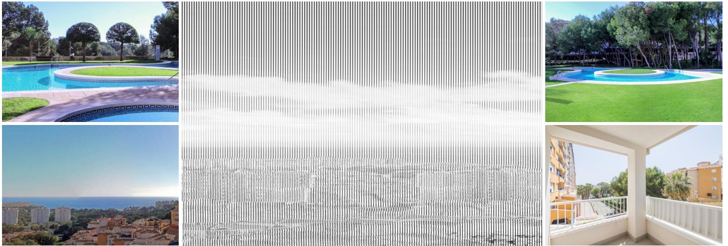
PENTHOUSE MIT MEERBLICK

Penthouse mit Meerblick und 10 Minuten Fußweg zum Strand.