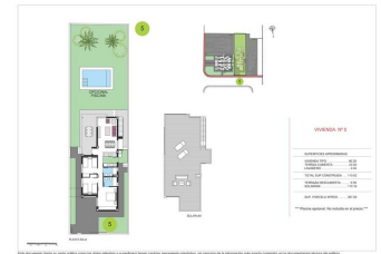
MEDITERRANE VILLA 1 KM VOM STRAND ENTFERNT

Villa in El Verger 1 km vom Strand entfernt mit großer privater Sonnenterrasse.