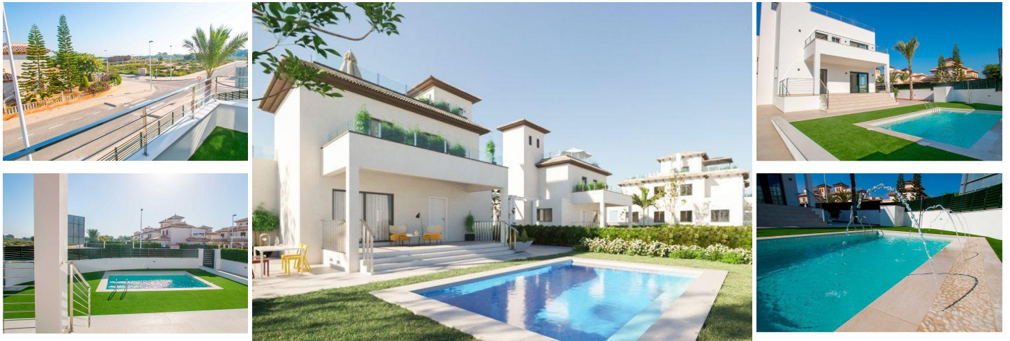
VILLA NEBEN DEM STRAND

Villa 3 Schlafzimmer, 2 Bäder, 3 Terrassen von ca. 50m 2 und ein Solarium von 27m 2 . PRIVATER POOL. Moderne Linie und sorgfältige Erinnerung an Qualitäten.