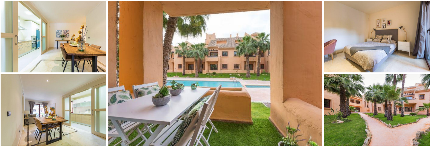
WOHNUNG IM MAR MENOR

Wohnung befindet sich 2 Gehminuten vom Strand und der Promenade Mar Menor entfernt.