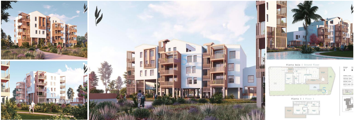
NEUBAU WOHNANLAGE IN EL VERGEL

Neubau-Wohnanlage mit Wohnungen und Penthäusern mit 1, 2 und 3 Schlafzimmern in El Verger, die als kompakte Strukturen konzipiert wurden, eine Antwort auf das ständige Streben der Architekten und Designer nach Effizienz in der Entwicklung. Diese Entscheidungen, die sich auf die verschiedenen Schlüsselpunkte des Wohngebiets verteilen, sorgen dafür, dass Ihr Zuhause sowohl im Winter als auch im Sommer die richtige Temperatur hat.