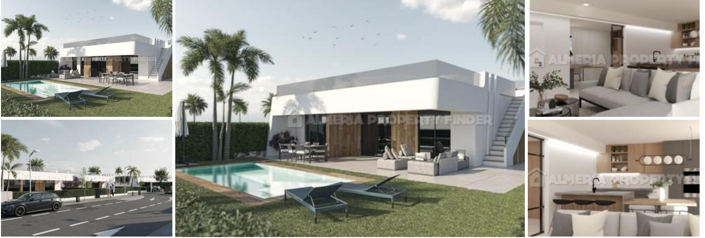
Alhama Nature Resort - Atenea II - Villa Nr. 2

Luxusvilla mit 92,91 m 2 bebauter Fläche, 259,10 m 2 Grundstücksfläche, 11,20 m 2 Terrasse, 147,75 m 2 Garten, 94,20 m 2 Solarium, Wohnzimmer, Küche, 3 Schlafzimmer, 2 Badezimmer mit Dusche, 2 Toiletten, pre-Installation von Klimaanlage, Schwimmbad, Parkplatz