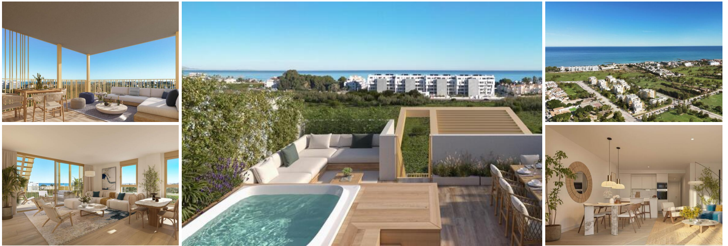
NEUBAU WOHNANLAGE IN EL VERGEL

Neubau-Wohnanlage mit Wohnungen und Penthäusern mit 1, 2 und 3 Schlafzimmern in El Vergel, die als kompakte Strukturen konzipiert wurden, eine Antwort auf das ständige Streben der Architekten und Designer nach Effizienz in der Entwicklung. Diese Entscheidungen, die sich auf die verschiedenen Schlüsselpunkte des Wohngebiets verteilen, sorgen dafür, dass Ihr Zuhause sowohl im Winter als auch im Sommer die richtige Temperatur hat.