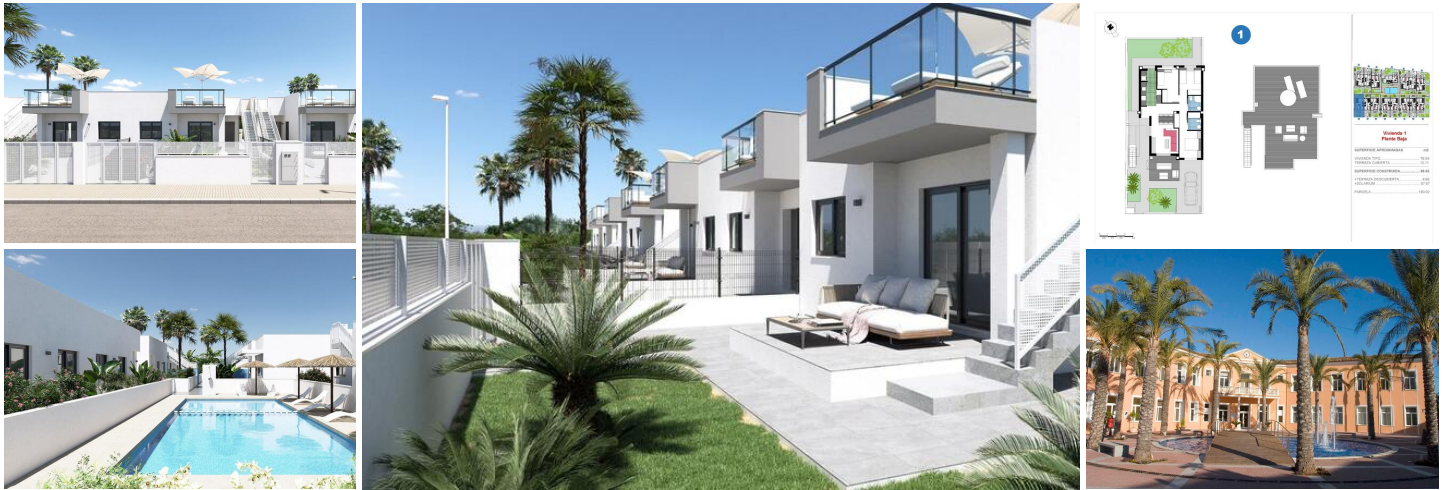
NEUBAU WOHNANLAGE IN EL VERGEL

Neubau-Wohnanlage mit Reihenhäusern und Doppelhaushälften mit Gemeinschaftspool in El Vergel.