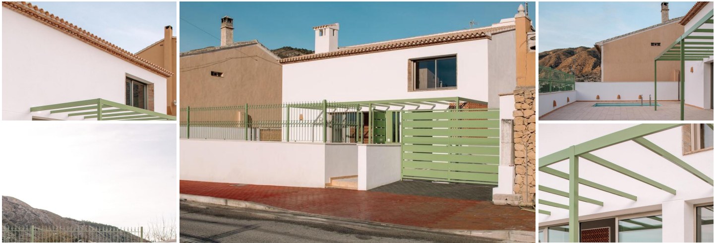
NEUGEBAUTE VILLA IN ORXETA

Neubau eines Einfamilienhauses in Orxeta, einer ruhigen Stadt in einem schönen und fruchtbaren Tal am Ufer des Flusses Sella und in der Nähe der Küste.