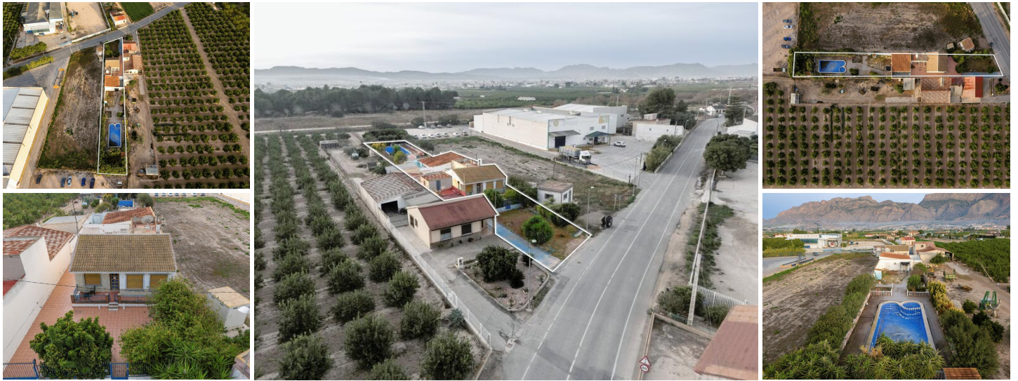
Charmante Finca mit 2 Häusern zum Preis von 1 in Orihuela

Entdecken Sie diese einzigartige, charmante Finca in der malerischen Stadt Orihuela, die nicht nur ein, sondern zwei Häuser zum Preis von einem bietet! Mit insgesamt 6 Schlafzimmern, 2 Küchen und 2 Bädern ist dieses Haus perfekt für Menschen, die ein Zuhause suchen, das sie gerne mit Freunden, Familie oder Bekannten teilen möchten. Das Haus besteht aus einem Haupthaus auf der Vorderseite, das geteilt werden kann und den Vorgarten nutzen könnte, und einem Haus auf der Rückseite, das dann über die gemeinsame Auffahrt, die neben dem Haus verläuft, zugänglich ist. Beide Häuser verfügen über eine geräumige und offene Küche, ein gemütliches Wohnzimmer und 3 Schlafzimmer. Auf der Rückseite des Grundstücks befindet sich ein riesiger privater Swimmingpool, der natürlich einer Auffrischung bedarf, so wie beide Häuser ein wenig Liebe gebrauchen könnten. Nach Renovierungsarbeiten bietet der Garten die Möglichkeit, eine Oase der Ruhe zu werden, in der Sie entspannen und die Sonne genießen können.