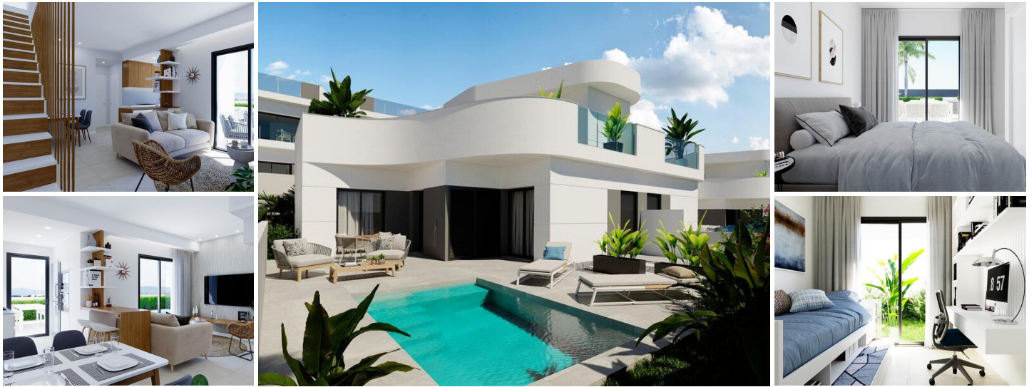
NEUBAU WOHNANLAGE IN LOS BALCONES, TORREVIEJA

Neubau Wohnanlage mit Doppelhaushälften und Bungalows in Los Balcones mit Blick auf den rosa See.