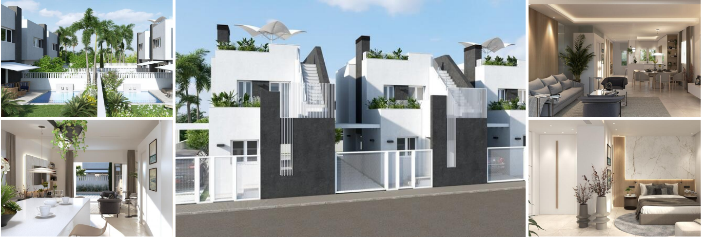
Res. Natura III - Luxusvillen in Pilar de la Horadada

Eine neue Promotion von 6 unabhängigen Luxusvillen mit privatem Pool und Parkplatz auf dem Grundstück steht zum Verkauf.