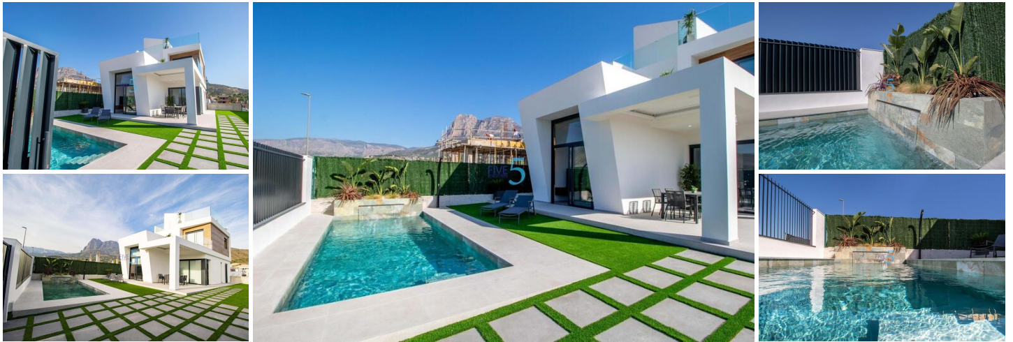
NEU GEBaute VILLEN IN FINESTRAT

Neubau einer Wohnanlage mit 22 Villen in Finestrat.