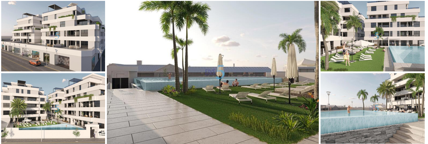
NEUBAU WOHNANLAGE IN SAN PEDRO DEL PINATAR

Neue Wohnanlage mit modernen Apartments und Penthäusern in San Pedro Del Pinatar.