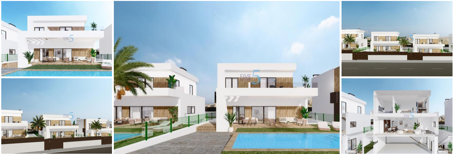
NEU GEBaute VILLEN IN FINESTRAT

Wohnanlage von modernen Villen wurde sorgfältig entworfen, um die Schönheit der Sierra Cortina und das Mittelmeer in jeder Ecke zu erfassen.