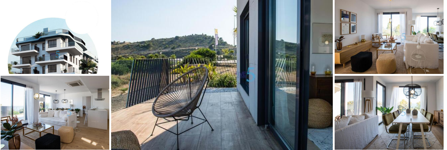
NEUBAU-KOMPLEX IN VILLAYOJOSA

Neue Wohnanlage mit 42 Wohnungen und Penthäusern in Villajoyosa, nur wenige Schritte vom Strand entfernt.