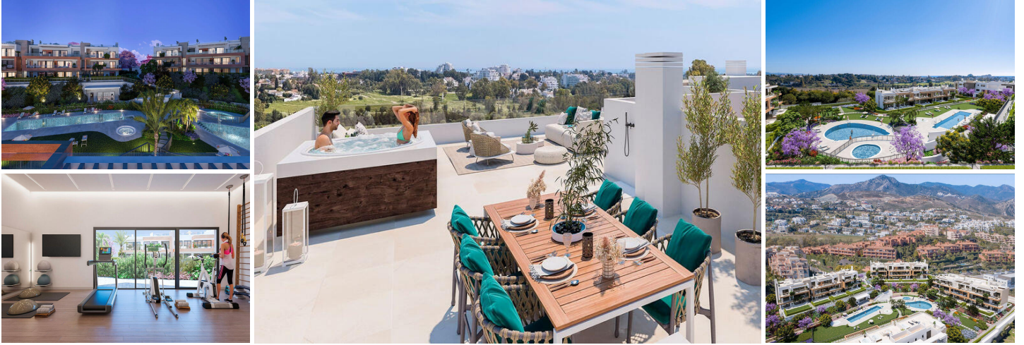
FILIPPA-Penthouse – Südlage mit Meerblick – Neubau – Estepona / Atalaya

Dieses Penthouse befindet sich in idealer Lage im Atalaya-Gebiet in Estepona, in der Nähe des prestigeträchtigen Atalaya-Golfplatzes, der Atalaya International School, von Geschäften und nur wenige Minuten von Puerto Banus entfernt.