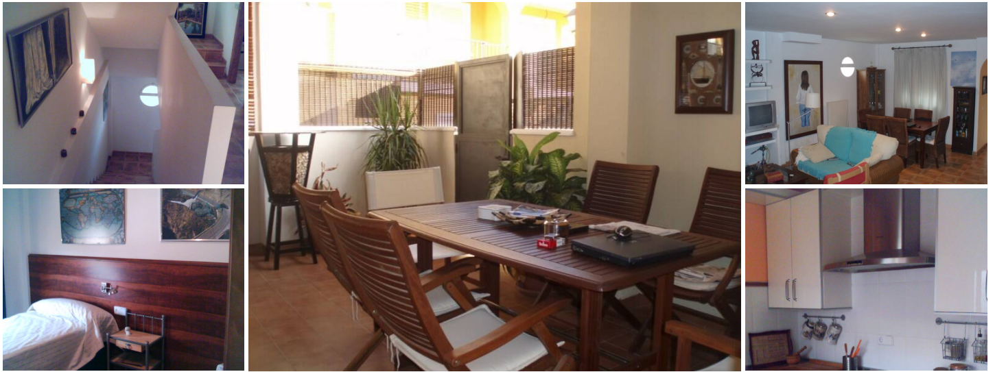
3-Zimmer-Maisonette zum Verkauf in Palomares, Almería.

Schöne Maisonette weniger als zwei Kilometer vom Strand entfernt. Der Eingang zum Haus ist perfekt in einer kleinen Urbanisation gelegen. Es verfügt über 3 Schlafzimmer und 2 Badezimmer, voll ausgestattete Küche. Im Obergeschoss befinden sich die Schlafzimmer mit Einbauschränken und Terrasse. Im oberen Teil des Hauses befindet sich eine Sonnenterrasse mit herrlichem Blick auf das Meer. Das Haus verfügt über eine Garage von mehr als 100 m 2 und Gemeinschaftspool