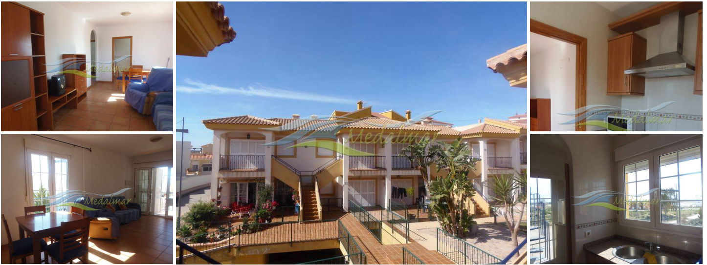
2 Schlafzimmer Penthouse in Palomares, Almería, Spanien.

Schöne Wohnung im ersten Stock mit 2 Schlafzimmern, die Wohnung befindet sich in der ruhigen Wohngegend von Valle del Almanzora entfernt. Das Haus verfügt über 2 Schlafzimmer mit Einbauschränken, 1 Bad, sehr geräumig und helles Wohnzimmer mit Zugang zu einer großen Terrasse vor dem Haus und eine andere Seite Balkon, von dem man einen herrlichen Blick auf die Küste genießen können. Die Küche ist separat mit mehreren Zonen und eine hintere Terrasse, von der mit herrlichem Blick auf einen Zugang zur Terrasse.