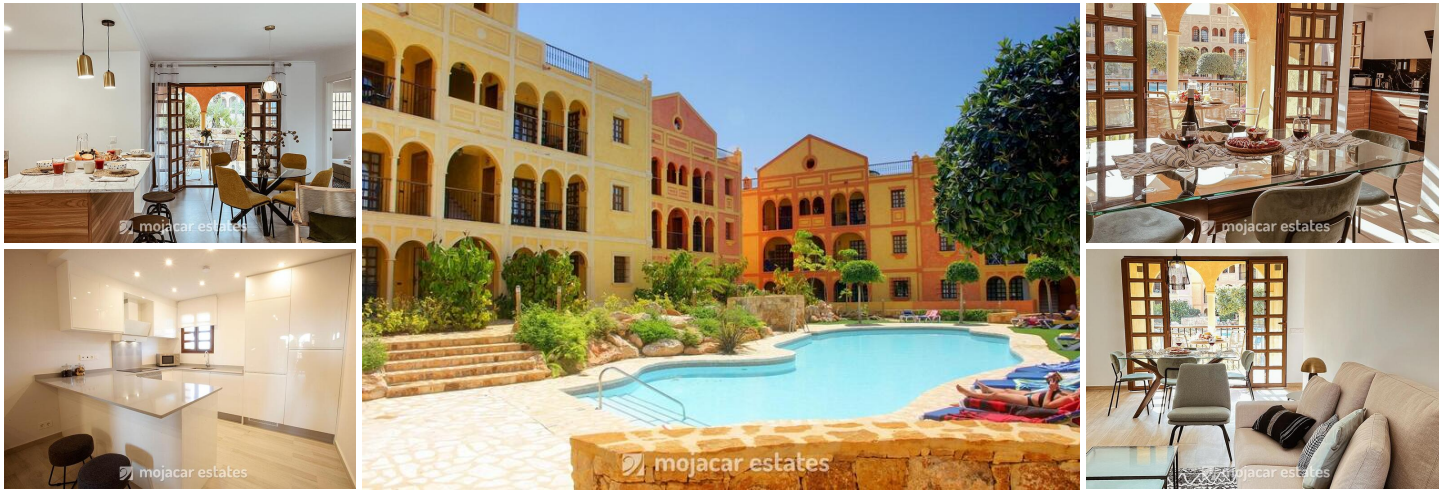
Las Sierras III

Neue "schlüsselfertige" Apartments mit 2 und 3 Schlafzimmern in der privaten Wohnanlage "Las Sierras III" im Desert Springs Golf Resort in der Nähe von Cuevas del Almanzora in Almeria, Andalusien.