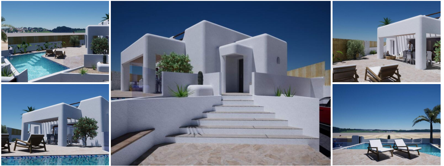
NYBYGGET VILLA I IBIZA-STIL I POLOP

Denne nybyggede eksklusive villa i Ibiza-stil er beliggende på en privilegeret grund i Polop, med vidunderlig udsigt til bjerget og havet.