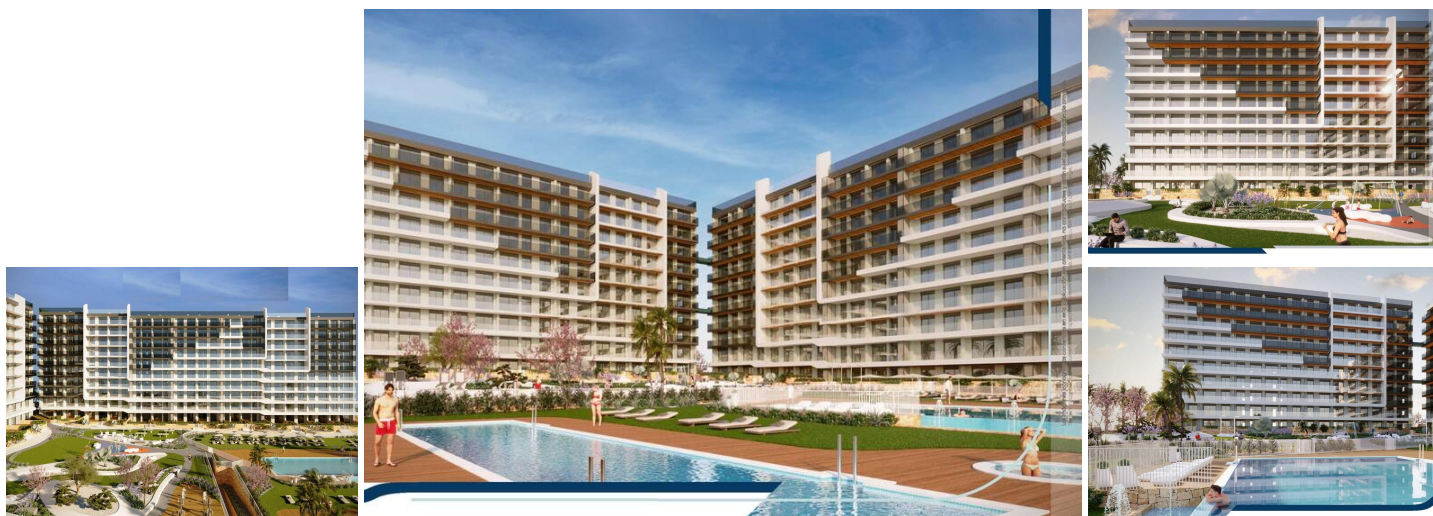
NYBYGGET BOLIGKOMPLEKS I PUNTA PRIMA

Nybygget boligkompleks med 220 lejligheder i Punta Prima, Torrevieja.