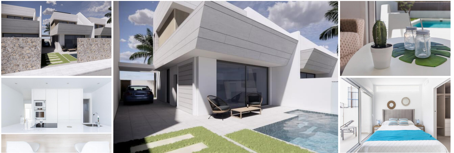
NYBYGGEDE VILLAER MED HALVTAGEDE HUSE I SANTIAGO DE LA RIBERA

Nybyggede parcelhusvillaer med 3 soveværelser, 3 badeværelser i Santiago de la Ribera.